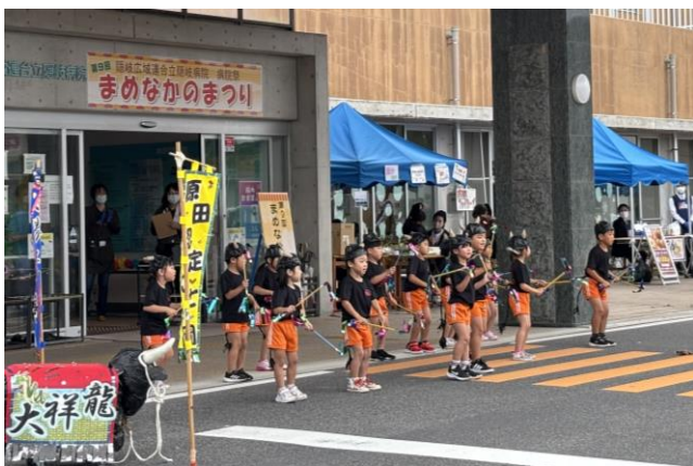
原田認定こども園のみなさん

10月19日（日）、第9回隠岐病院祭「まめなかのまつり」を開催しました。前日は雨模様でしたが、当日は無事に雨が上がり、たくさんの方の地域の皆さまにご来場いただきました。