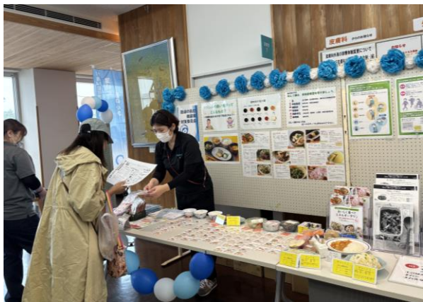
糖尿病対策の展示コーナー

で盛り上がりました。今年の新企画として、病院スタッフの一日を紹介する動画を制作し上映しました。さまざまな職種の仕事内容を紹介することで、より病院の役割について知っていたり、機会となりました。会場には屋台を設け、10店舗による様々な出店を行い、多くの方々に寄り添っていただき、家族連れを中心ににぎわいました。今年も地域の皆さまとの交流が広がる時間となり、病院祭は無事終了しました。これからも地域と協力しながら、安全で信頼される医療の実現をめざして、より一層努めてまいります。