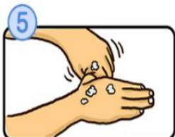
親指と手のひらをねじり洗います。