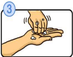
指先・爪の間を念入りにこすります。