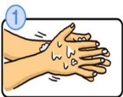
流水でよく手をぬらした後、石けんをつけ、手のひらをよくこすります。