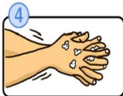
指の間を洗います。