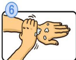
手首も忘れずに洗います。

うか。冬場に流行するウイルスはもともと高温、高湿度では長く生存できないためだと言われています。一般に、エアコンやファンヒーターで室温は上げられていますが、湿度は割と低く乾燥しています。加湿器を利用したり、やかんでお湯を沸かしたり、洗濯物を干しておくのも良いでしょう。その他にも色々な風邪予防があると思いますが、最後には自身の抵抗力がカギとなります。侵入したウイルスを増殖させず、軽い症状ですむようにするためには、普段からバランスの良い食事、十分な睡眠で自身の免疫力を高めておくことが重要となります。