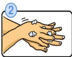
手の甲をのぼすようにこすります。