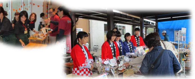
あいにくの雨だった出店コーナー