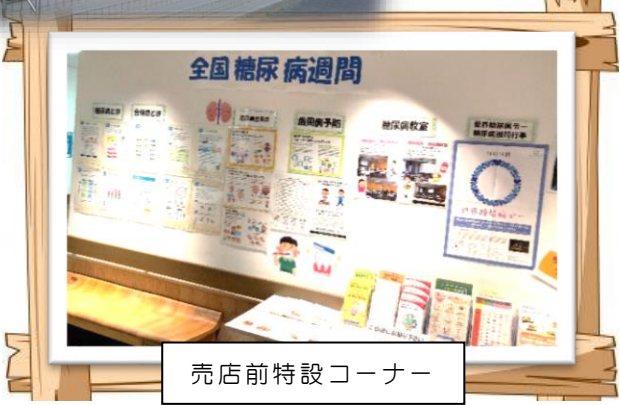
売店前特設コーナー