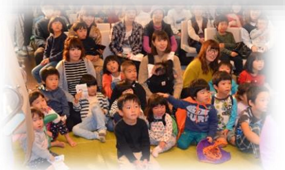
Dr レンジャーの登場 を待つ子供達!!