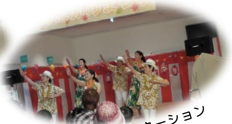
フェア・カーネーション