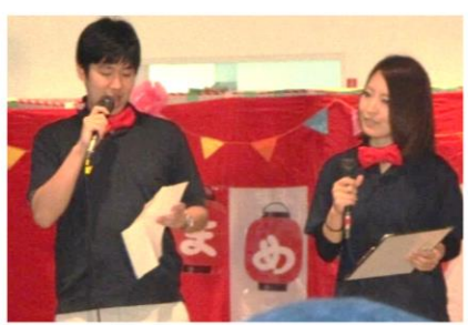
整形若槻医師 & 佐々木栄養士