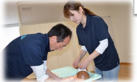
初孫の帰省が待遠しい♪