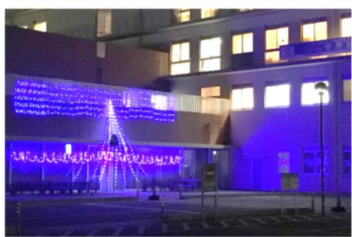
ライトアップされたコリドー

隠岐地域においては糖尿病の 患者さんが多い状況の中、今後 もこの活動を継続し糖尿病につ いて考える機会になればと思 います。