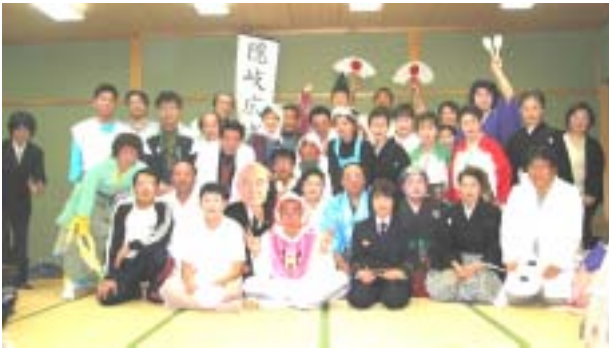
参加者全員での記念撮影!