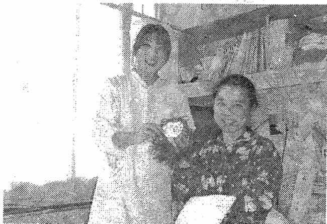
皆さんに喜んでいただきました！

暮れのクリスマスに病院玄関前 の松の木をクリスマスツリーに見 立て、たくさんの電飾が、労組青 年部によって飾られました。