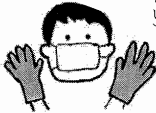
その他：長靴やエプロン

・処理をされる方は、ご自分の防御の為、マスク・使い捨て手袋を着用する(手袋をはずしたあとも、必ず手洗いをしてください)